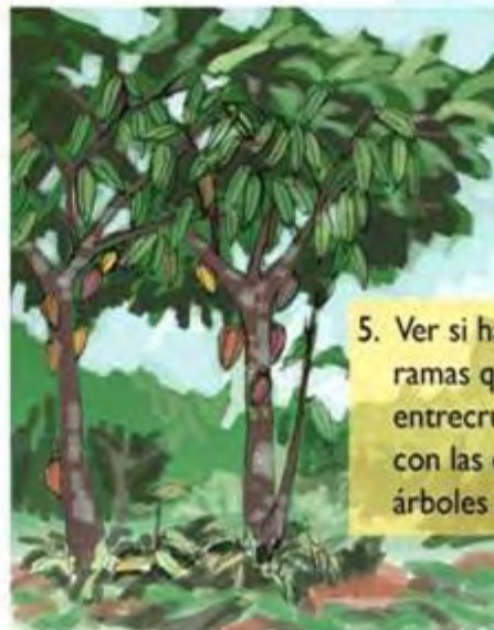
5. Ver si hay ramas que se entrecruzan con las de otros árboles

Puede haber árboles que tengan varios de estos problemas a la vez.