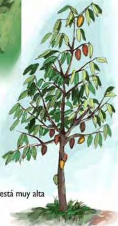
2. Ver si la copa está muy alta