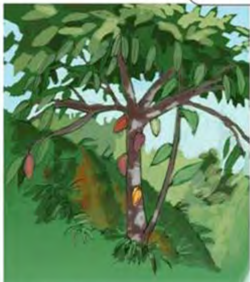
1. Ver si la copa está muy baja