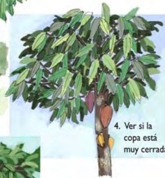
4. Ver si la copa está muy cerrada