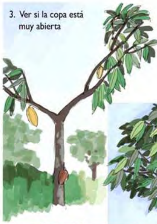
3. Ver si la copa está muy abierta