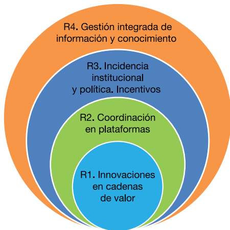
Figura 1. Resultados definidos para el proyecto