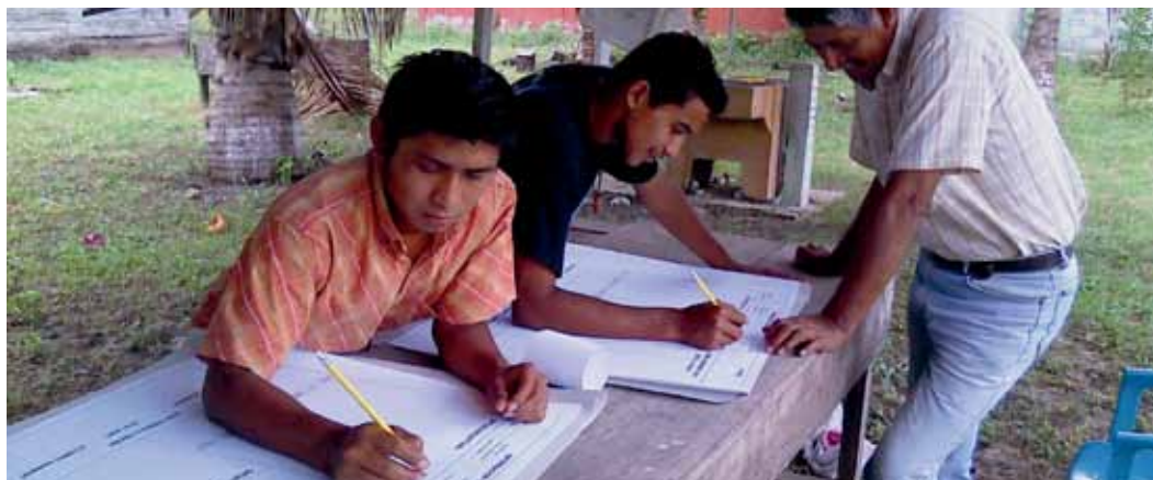
Elaboración de mapa de finca, FUNDEBASE, Petén.

A través del Programa Agroambiental Mesoamericano (MAP) el CATIE genera iniciativas que contribuyen a desarrollar y promover el uso sostenible de la tierra para mejorar los medios de vida rurales. El programa otorga fondos competitivos para promover que organizaciones locales y nacionales cuenten con, y generen, herramientas, conocimientos y capacidades para poner en práctica innovaciones tecnológicas, políticas y programas.