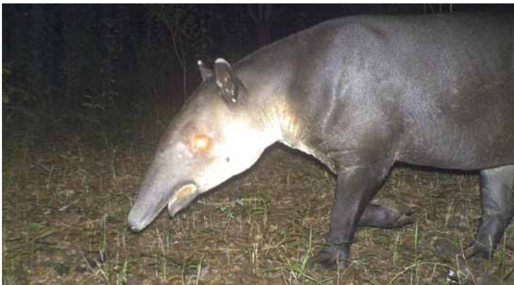
Monitoreo de tapir con apoyo del Proyecto Selva Maya.

E l Proyecto Fomento del Manejo del Ecosistema Trinacional de la Selva Maya ejecutado por el CATIE en Guatemala concluyó con éxito. A través de esta iniciativa se promovió una relación estrecha de la gestión pública entre los países para el aprovechamiento sostenible y conservación de los recursos naturales y la biodiversidad, como un bien de interés público. Con una extensión aproximada de 4.230.000 ha, este ecosistema concentra entre un 8% y un 12% de la biodiversidad total del planeta y por su riqueza natural y cultural se ha convertido en uno de los más ricos del mundo.