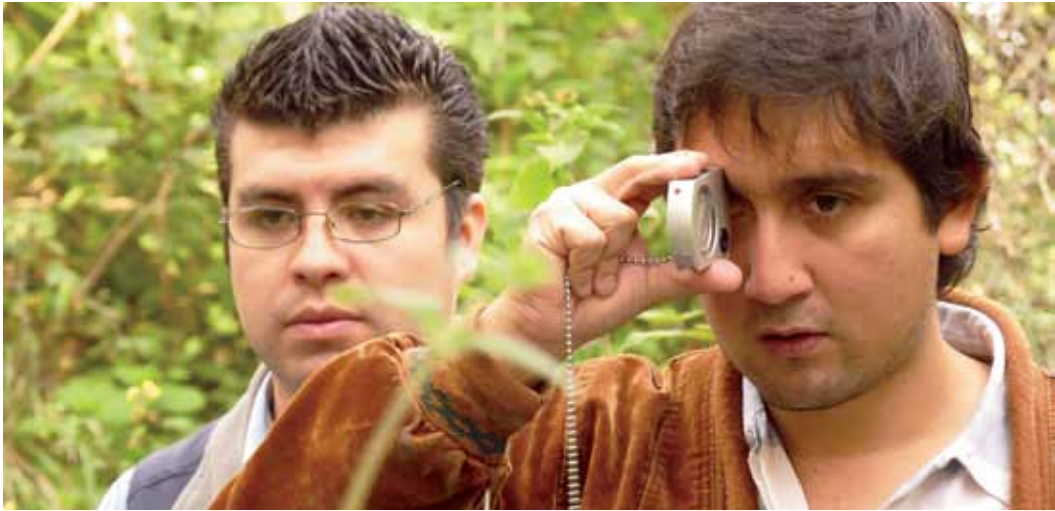
Participante del curso de manejo de coníferas utiliza equipo de medición forestal en Chimaltenango.

marco de cooperación existente entre el INAB y el CATIE. Ambas instituciones trabajan en conjunto en el fortalecimiento y la recuperación de la red de Parcelas Permanentes de Medición Forestal (PPMF) establecidas en el bosque natural de coníferas, en Guatemala.