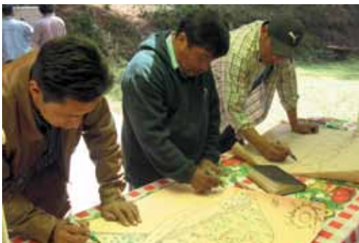
Fortalecimiento de capacidades.

E l Parque Regional Municipal Astillero de Tecpán (PRMAT) en Guatemala es uno de los bienes municipales de mayor interés para la conservación en la región de la Cadena Volcánica Central. Con una extensión de 1.506,96 ha el parque presenta una cobertura del 94% de bosque natural. El PRMAT forma parte de la zona de recarga hídrica de las cuencas Madre Vieja, Motagua y Coyolate (subcuenca Xayá) en la cual se ubican alrededor de 150 fuentes de agua que abastecen los municipios de Chimaltenango, Sololá y Quiché. Las subcuencas de los ríos Xayá–Pixcayá aportan aproximadamente 140 m 3 de agua diarios a la ciudad de Guatemala.