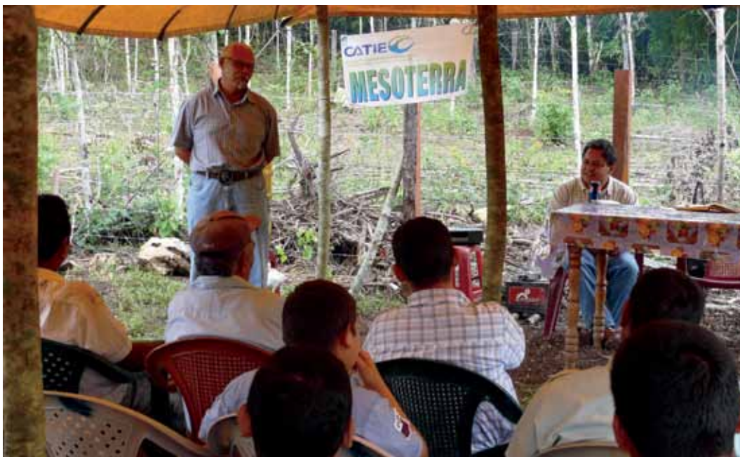
El CATIE utiliza las escuelas de campo como metodología de aprendizaje.

E l CATIE a través del proyecto Manejo Sostenible de Territorios Agropecuarios en Mesoamérica (Mesoterra) tiene como objetivo incidir para que organizaciones públicas, privadas y comunidades rurales de Mesoamérica promuevan un manejo más sostenible de territorios agrícolas que resulte en mayor resiliencia al cambio climático, mejoras en el bienestar de las familias productoras y comunidades, así como la recuperación de servicios ecosistémicos.