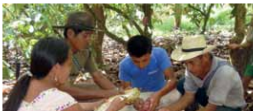
Escuela de campo sobre enfermedades del cacao en Santa María, Cabadón.

Más de 2.000 familias productoras de cacao de 25 organizaciones productoras de Alta Verapaz y de la Costa Sur forman el Comité Nacional de Cacao de Guatemala (CONCAGUA). Las pequeñas y pequeños productores cuentan ahora con una representación nacional originada en las bases de las organizaciones, instancia que trabaja en el fortalecimiento del sector y funge como interlocutor con las instituciones del Estado.