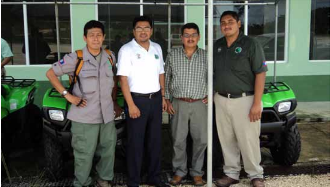
Colaboración con el Departamento Forestal de Belice en 2010.

Entre los beneficios generados se destaca el acercamiento de distintas instituciones gubernamentales, académicas, organismos no gubernamentales y actores locales de los tres países e instancias de cooperación internacional.