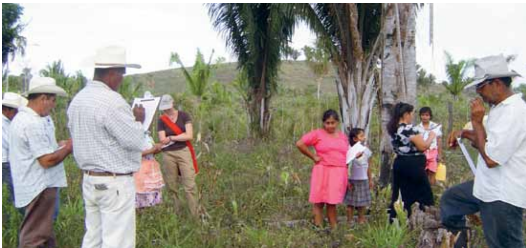
El CATIE trabaja en el manejo sostenible de la tierra en pasturas degradadas en Petén.

E l CATIE a través del Proyecto Desarrollo Participativo de Alternativas de Usos Sostenibles de la Tierra en Áreas de Pasturas Degradadas implementó actividades enfocadas en el fortalecimiento de las habilidades y capacidades de las familias productoras ganaderas en la zona del Chal en el Petén. El enfoque participativo reunió a familias productoras, así como sectores de investigación, academia, cooperación técnica y política para identificar limitaciones y oportunidades que podrían contribuir a encontrar y validar tecnologías que reduzcan el impacto de la degradación de pasturas en las zonas ganaderas.