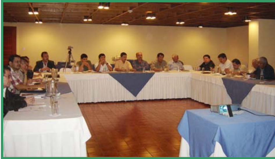
Participantes en el taller organizado por la OTN e INAB, marzo de 2007.