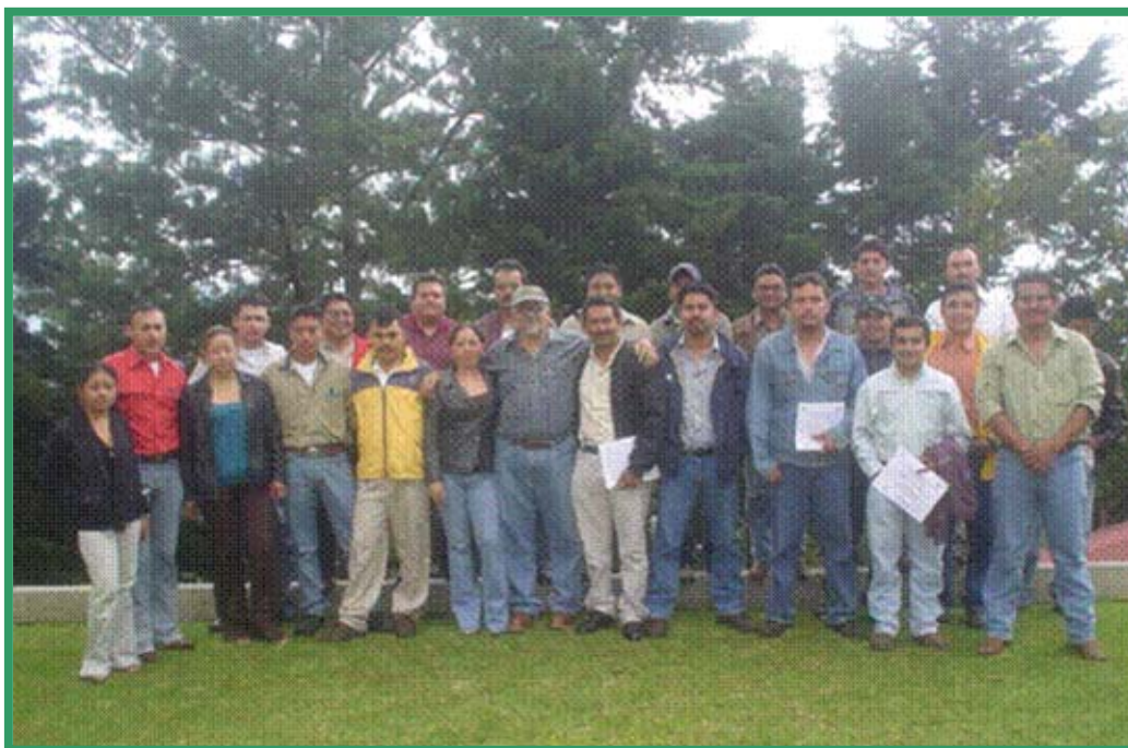
Asistentes al curso de Abordaje de los conflictos sociales relacionados con el uso sostenible de los recursos naturales . San José Pinula, Guatemala, julio de 2007.

En el área de capacitación, se coordinó y ejecutó un total de seis (6) cursos , dirigidos principalmente a instituciones socias, así como a otras instituciones no socias, además de programas y proyectos nacionales y técnicos y profesionales de las diferentes disciplinas impartidas. De esta manera se contó con participación de más de 100 asistentes, mujeres y hombres, entre técnicos y profesionales en cursos temáticos, en tanto que se contó con la asistencia de 80 participaciones en capacitación y asistencia en temas administrativos y financieros, principalmente a nivel de proyectos.