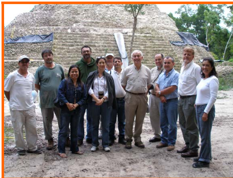
Actividades de restauración arqueológica en Yaxha, Petén.

Se ha dado seguimiento a la fase de ampliación de la ejecución del Programa negociado en el 2004, cuya finalización se hizo efectiva en octubre de 2007. Se considera que durante el año 2007 se incrementaron las acciones de coordinación y cooperación con la Comisión Presidencial para el Desarrollo de Petén, así como con el Viceministerio del MAGA en Petén y el BID, estableciendo mas acciones de índole técnica, participando en consultas para la formulación de una siguiente fase del programa. Como parte de la coordinación se apoyó el cierre del proyecto, preparando las bases para el cierre administrativo. Vale destacar como un logro importante el cierre satisfactorio del Programa de parte del MAGA y del BID, lo cual permitió al CATIE recuperar el 10% retenido por el BID.