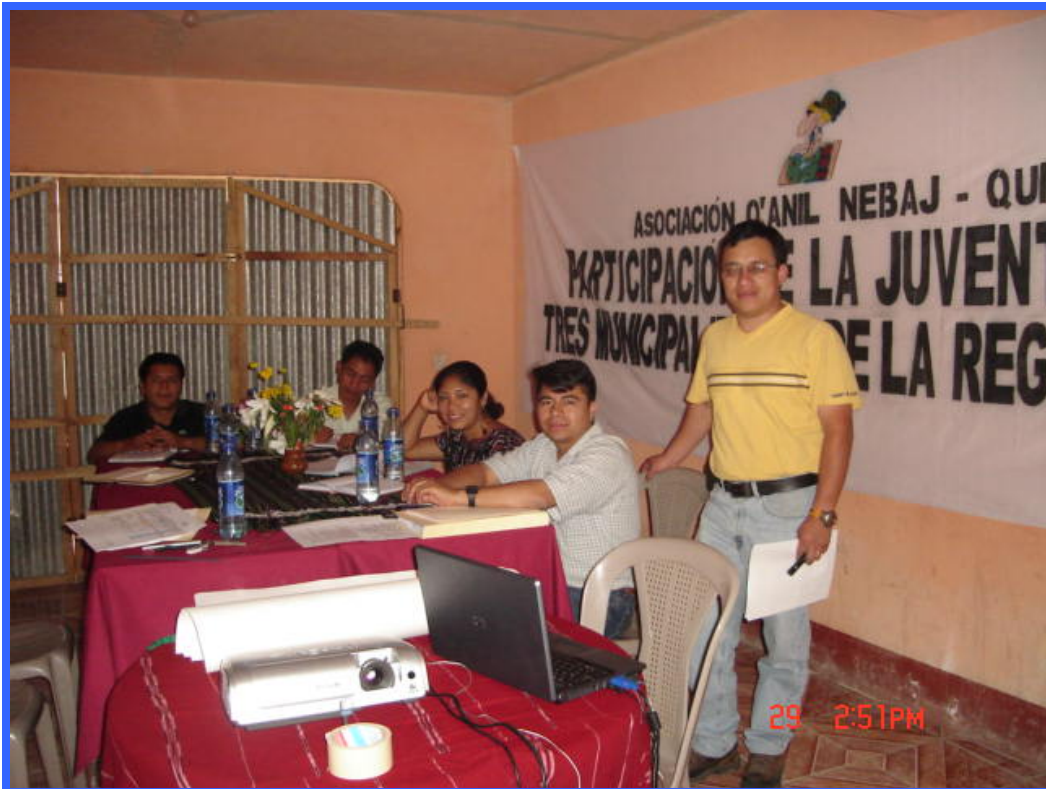
Aplicación del sistema de monitoreo con la Asociación Q´anil, Nebaj, El Quiché.

Asimismo, se ha tenido una activa participación en el Consejo Directivo en el seno del cual se trabaja en aspectos de análisis y seguimiento al accionar de la dirección y actividades del mecanismo.