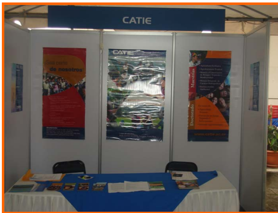
Stand OTN Guatemala – Feria de Becas de SEGEPLAN, MUSAC, Guatemala

Feria de Becas: La OTN participó, mediante el montaje de un stand, distribución de material y charlas informativas, en la VI Feria de Becas , organizada por la Secretaría General de Planificación y Programación de la Presidencia (SEGEPLAN) efectuada del 24 al 25 de noviembre de 2007, en las instalaciones del Museo de la Universidad de San Carlos de Guatemala.